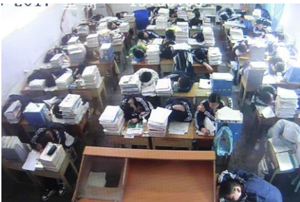
Big brother is watching.... maar de klas slaapt.