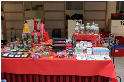
Stand van Stichting Eline tijdens Chinees Nieuwjaar, stadhuis van Den Haag.