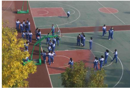
Het sportveld van Middle School no. 1