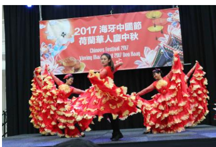
Optreden tijdens het festival.