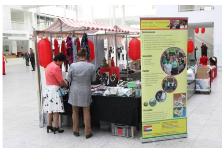
Onze kraam in Den Haag, 9 september.

Tijdens de 15e dag van de 8e maand van de Chinese kalender wordt het Mid-Autumn Festival gevierd. Deze dag valt in september of oktober. Volgens Chinezen is op deze dag de maan het grootst en het mooist. De romantische legende van Chang'e maakt het een dag waarop stelletjes samen de maan bewonderen. Tijdens het festival zullen Chinezen offers doen aan de maan. Hier moeten in elk geval wierook en watermeloen bij zitten. Onmisbaar tijdens het feest zijn de mooncakes. Dit zijn grote vierkante of ronde gevulde koeken van 4-5 cm dik. De korst is slecht 2-3 mm dik, dus de vulling is het belangrijkste. De traditionele vulling is lotuspasta met het eigeel van een gezouten eendenei. Andere vullingen met bonen-, jujube-, noten- of fruitpasta komen ook voor. Deze zoetheid is zo populair dat het festival ook wel het Mooncake Festival wordt genoemd.