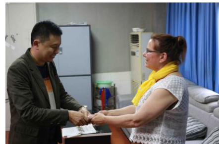
Overhandigen van het geld voor het nieuwe semester.