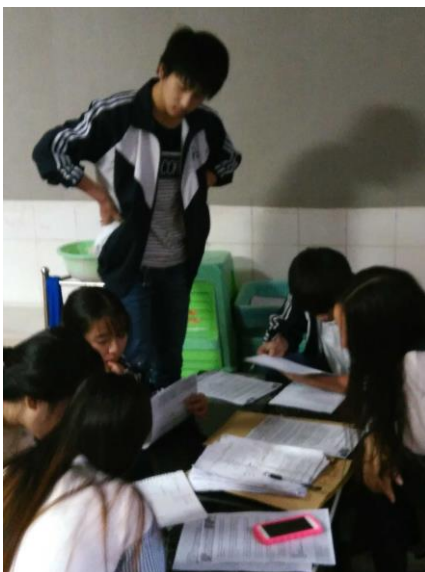
De scholieren vullen vragenlijsten in

Na een goede reis met de hogesnelheidstrein waren we binnen een uur van Chongqing in Fuling. Het valt altijd op hoe goed we worden geholpen door de directie van de Fuling Senior High School. We werden ook nu weer opgehaald bij het station en naar de school gebracht.