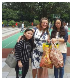
Overhandigen van de knuffels