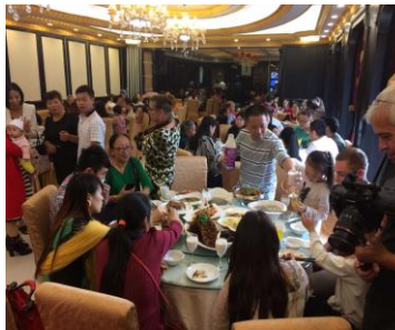
Het diner tijdens het 100-dagen feest