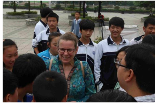
Vele handtekeningen moesten worden gezet