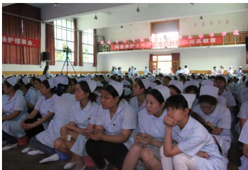
Aula tijdens de praktijkexamens